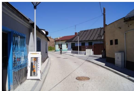
Zabudowa przy ulicy Pieńkowskiego