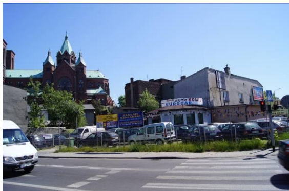
Komis samochodowy przy skrzyżowaniu ulic S. Staszica i 1 Maja

Załącznik nr 1 do Uchwały nr XXV/336/2016 Rady Miejskiej w Czeladzi z dnia 19 maja 2016 r.