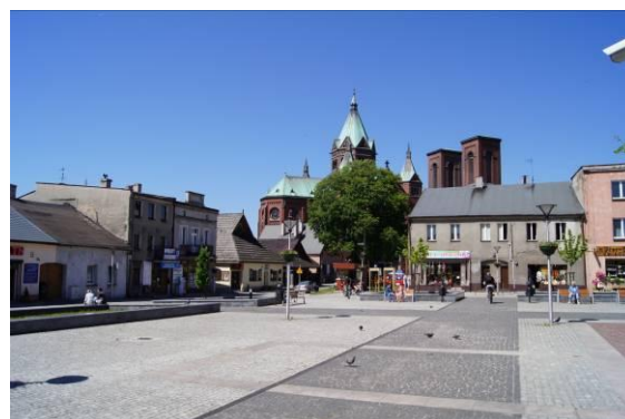
Rynek – pierzeja południowa i zachodnia