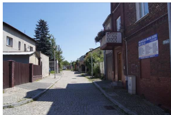
Zabudowa przy ulicy Kaczej