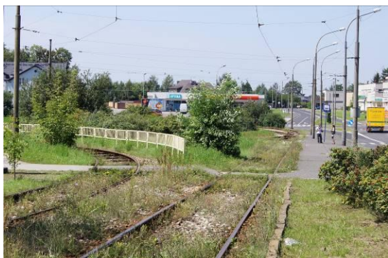
Pętla tramwajowa przy ulicy Kombatantów