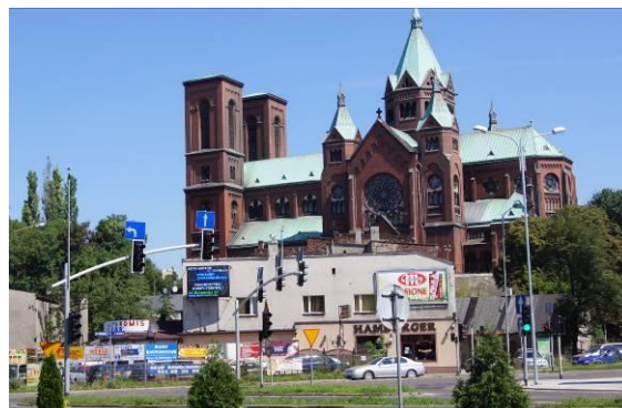
Zabudowa przy skrzyżowaniu ulic S. Staszica i 1 Maja