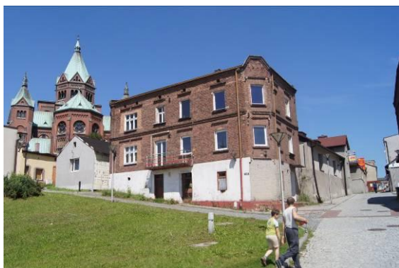
Zabudowa przy ulicy Walnej i Katowickiej