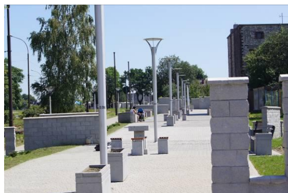
Deptak przy ulicy Kombatantów