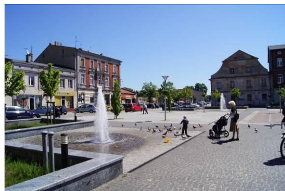
Rynek – pierzeja północna i wschodnia