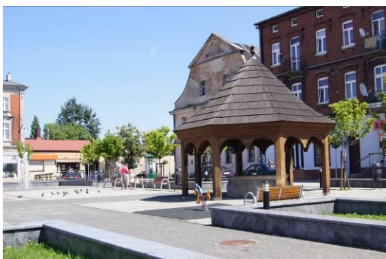
Miejska studnia na Ryнку