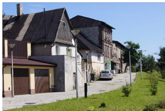
Zabudowa przy ulicy Ciasnej