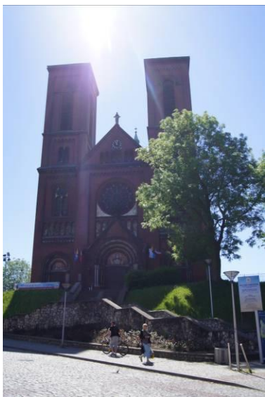
Kościół parafialny p.w. Świętego Stanisława Biskupa Męczennika