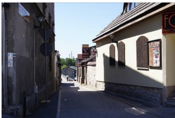
Zabudowa przy ulicy Katowickiej