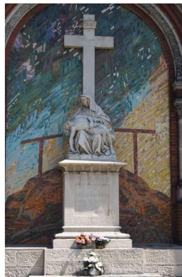
Grupa figuralna - Pieta