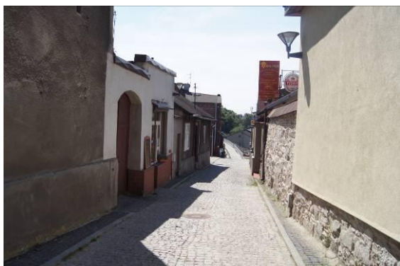
Zabudowa przy ulicy Katowickiej

Załącznik nr 1 do Uchwały nr XXV/336/2016 Rady Miejskiej w Czeladzi z dnia 19 maja 2016 r.