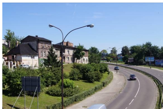
Ulica S. Staszica z zabytkową zabudową przy ulicy Ciasnej