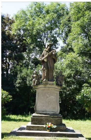
Kamienna figura Św. Jana Nepomucena