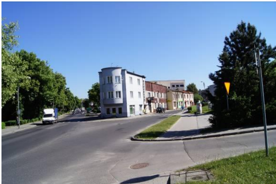
Zabudowa przy skrzyżowaniu ulic 1 Maja i Katowickiej