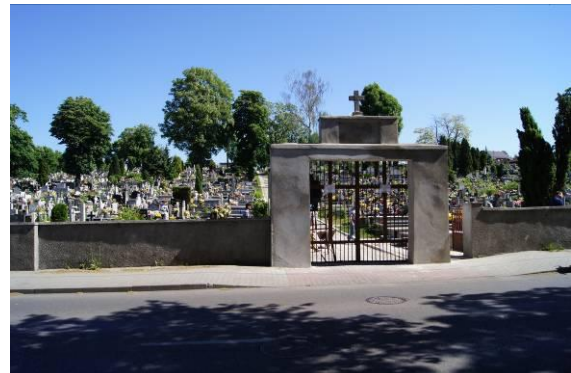
Cmentarz parafialny przy ulicy Nowopogońskiej – brama główna