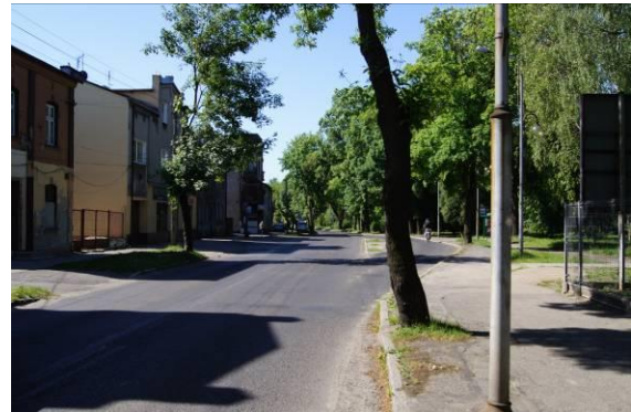
Zabudowa przy ulicy Katowickiej