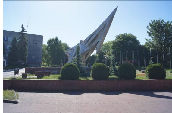
Pomnik przed budynkiem Urzędu Miejskiego przy ulicy Katowickiej