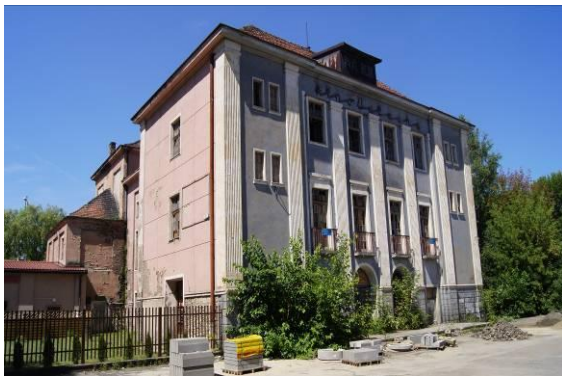
Dawne kino „Uciecha” przy ulicy 1 Maja