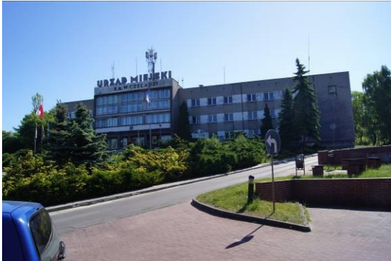
Budynek Urzędu Miejskiego przy ulicy Katowickiej