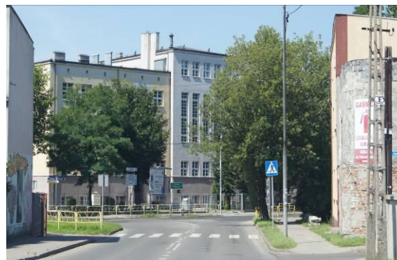
Gimnazjum przy skrzyżowaniu ulic Nowopogońskiej i Katowickiej