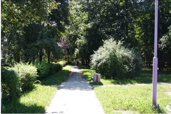
Wejście do Parku im. T. Kościuszki przy ulicy 1 Maja

Załącznik nr 1 do Uchwały nr XXV/336/2016 Rady Miejskiej w Czelandzi z dnia 19 maja 2016 r.