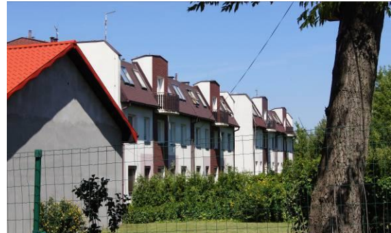
Zabudowa przy ulicy Słowińskiej