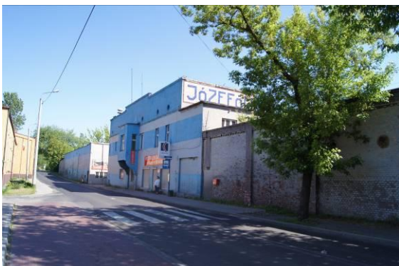
Byłe zakłady płytek ceramicznych „Józefów” przy ulicy Katowickiej