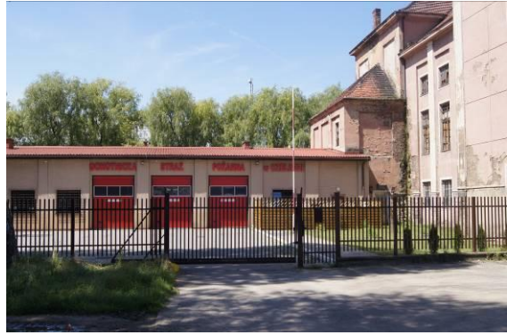
Budynek OSP przy ulicy 1 Maja