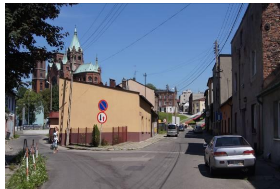
Zabudowa przy ulicy Żabiej i Katowickiej