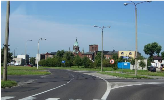
Zabudowa przy skrzyżowaniu ulic Będzińskiej, Grodzieckiej i Słazica

Załącznik nr 1 do Uchwały nr XXV/336/2016 Rady Miejskiej w Czeladzi z dnia 19 maja 2016 r.