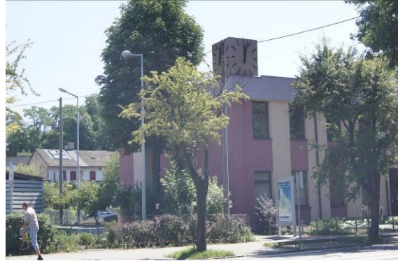
Miejska Biblioteka Publiczna przy ulicy 1 Maja