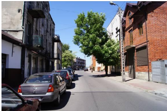
Zabudowa przy ulicy Bytomskiej