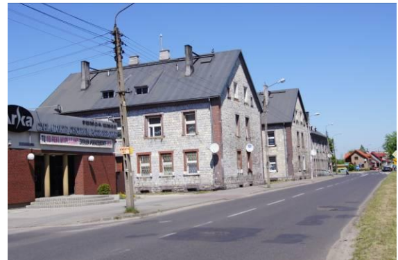
Zabudowa przy ulicy Szpitalnej