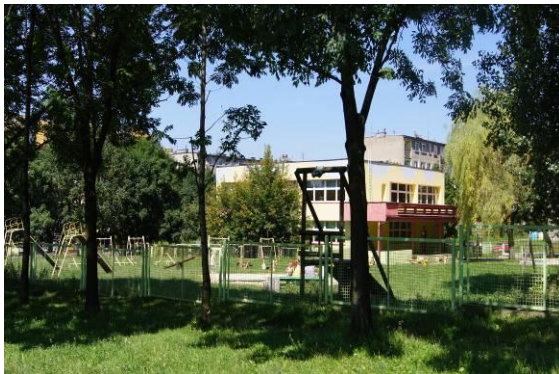
Przedszkole na osiedlu Miasta Auby