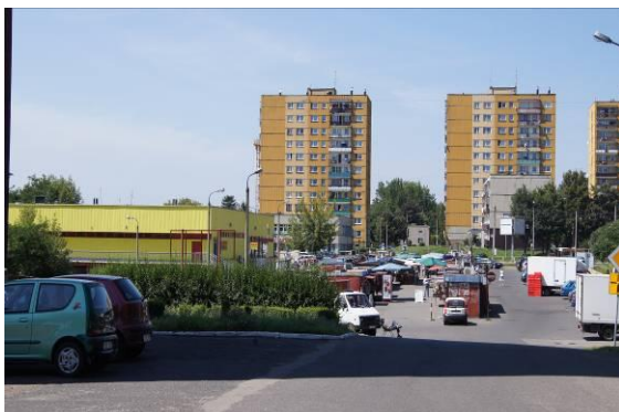
Widok na osiedle Ogrodowa