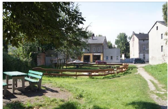
Plac zabaw przy ulicy Przetąjskiej