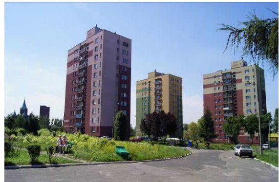
Budynki wielorodzinne na osiedlu Miasta Auby