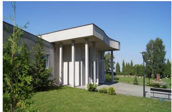
Kaplica na cmentarzu komunalnym przy ulicy Wojkowickiej