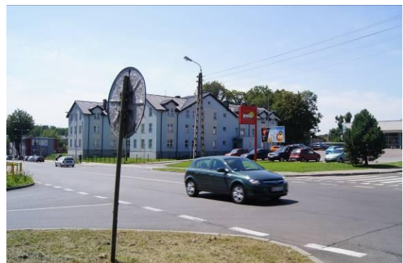
Skrzyżowanie ulic Szpitalnej i Komбатantów