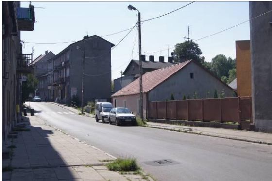
Zabudowa przy ulicy Kilińskiego

Załącznik nr 1 do Uchwały nr XXV/336/2016 Rady Miejskiej w Czeladzi z dnia 19 maja 2016 r.