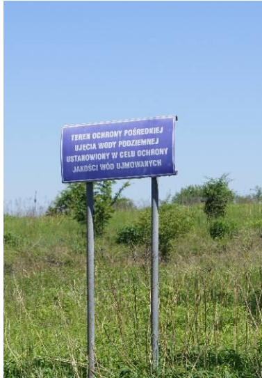
Tablica informacyjna o strefie ujęcia wody podziemnej