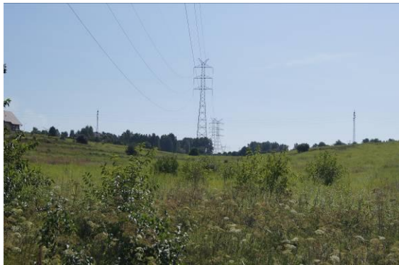
Tereny otwarte przy ulicy Przetąjskiej