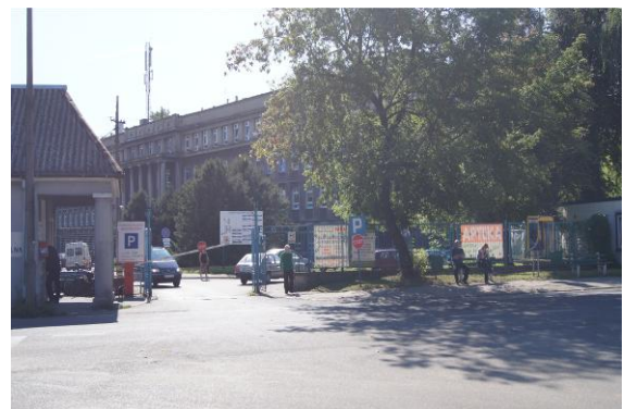
Szpital Powiatowy przy ulicy Szpitalnej – brama główna