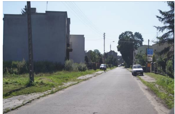
Zabudowa przy ulicy Przetąjskiej