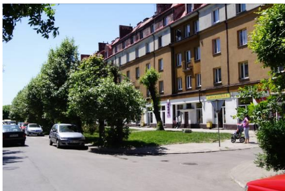
Zabudowa przy ulicy 17 Lipca