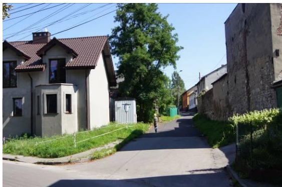
Zabudowa przy ulicy Jana III Sobieskiego i ulicy Przetąjskiej