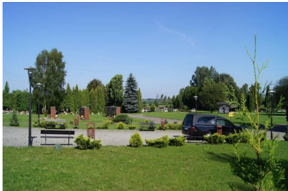
Cmentarz komunalny przy ulicy Wojkowickiej

Załącznik nr 1 do Uchwały nr XXV/336/2016 Rady Miejskiej w Czeladzi z dnia 19 maja 2016 r.