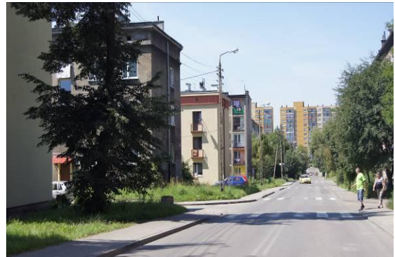
Zabudowa przy ulicy Tuwima z widokiem na osiedle Ogrodowa