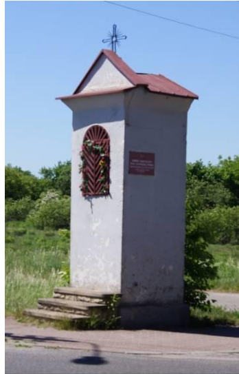
Zabytkowa kapliczka przy ulicy Wojkowskiej wpisana do rejestru zabytków Województwa Śląskiego