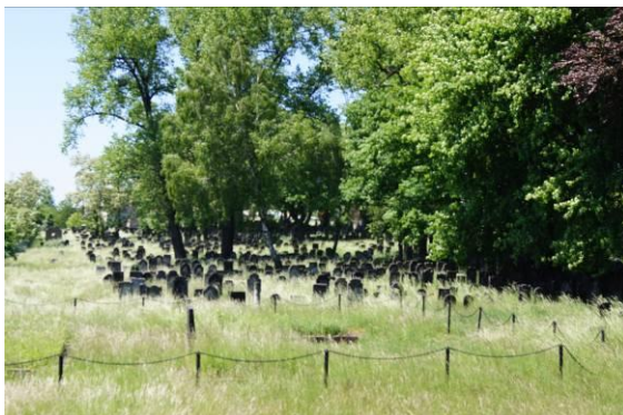
Cmentarz żydowski przy ulicy Będzińskiej