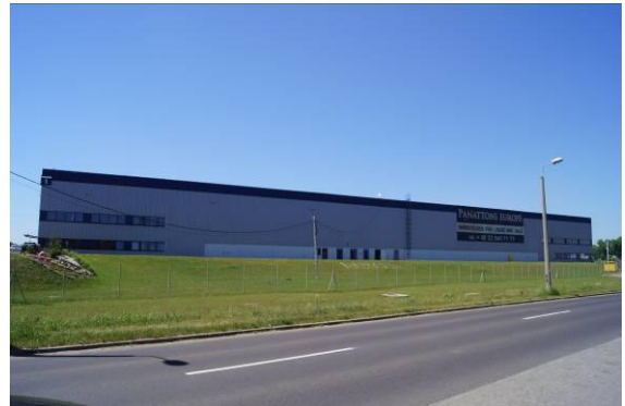
Magazyny firmy „Panattoni” przy ulicy Handlowej