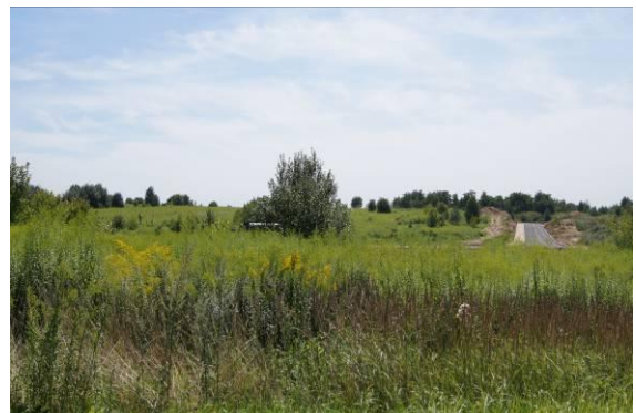
Nowa inwestycja drogowa – widok od ulicy Będzińskiej