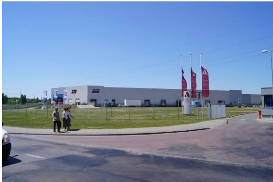
Magazyny firmy „Winkler” przy ulicy Wiejskiej