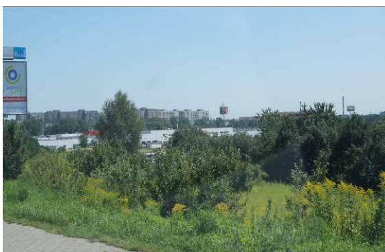
Centrum Handlowe „M1” przy ulicy Handlowej