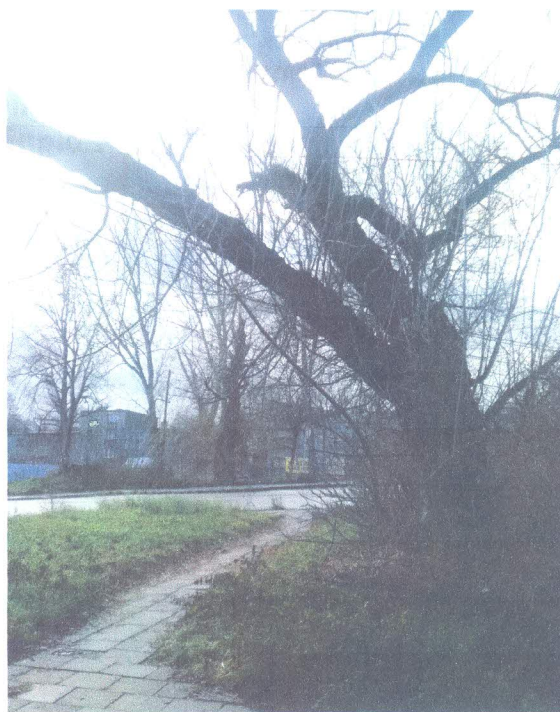
C – zaniedbany i zarośnięty chodnik na ul. Niwa