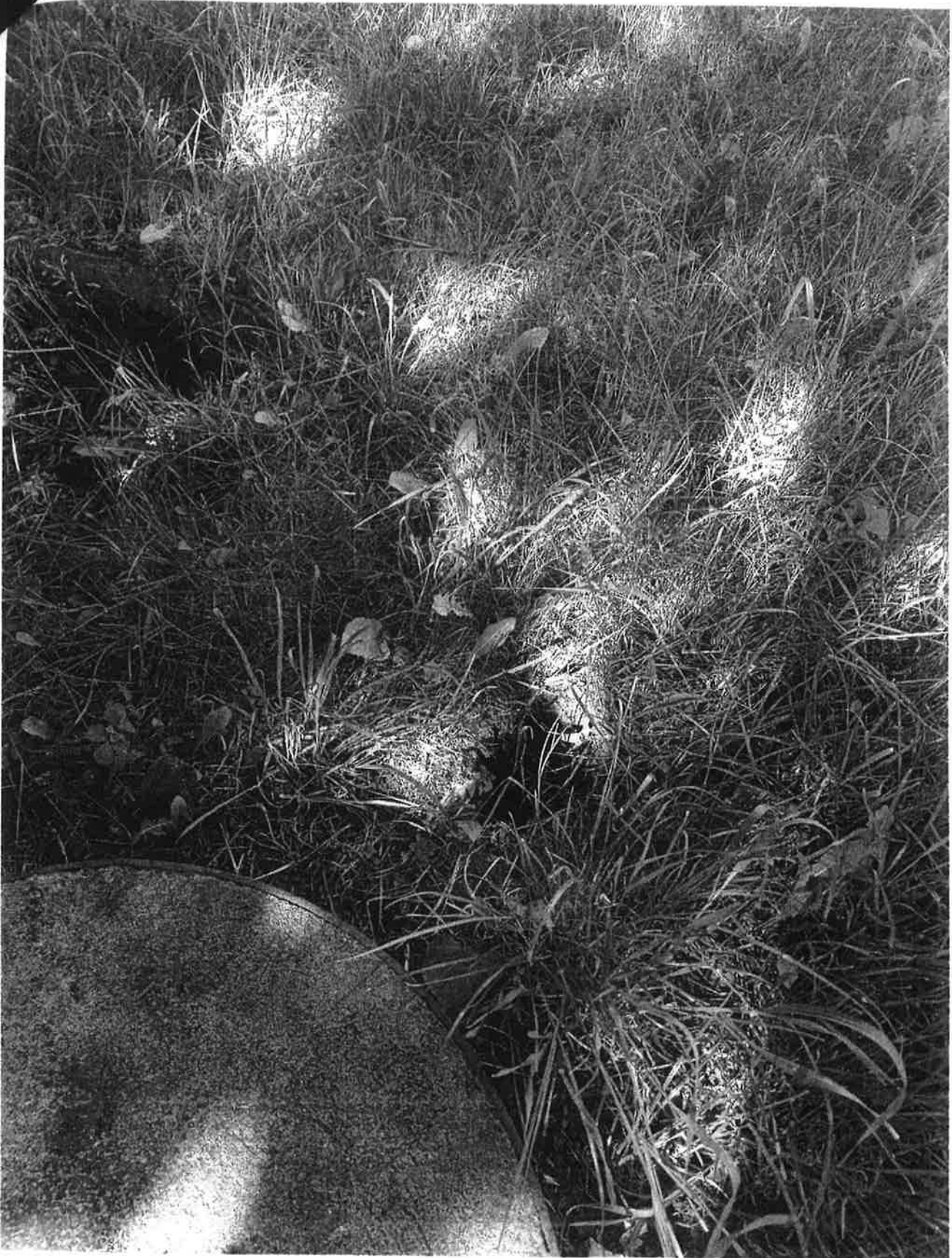
— 20210611_082018.jpg —