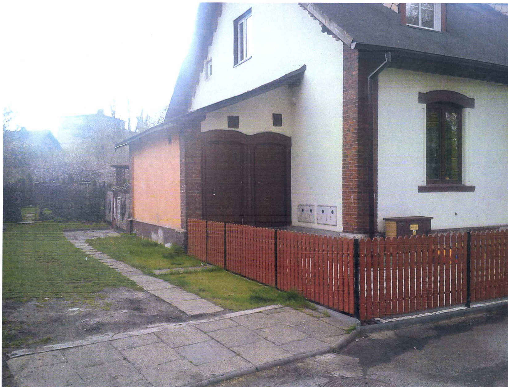
Załącznik nr 2 – zdjęcia