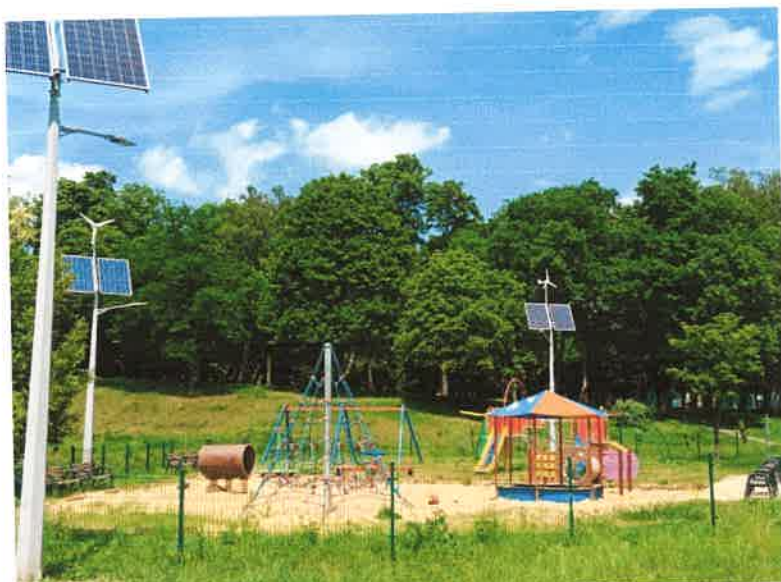
Plac zabaw w Parku Alfred