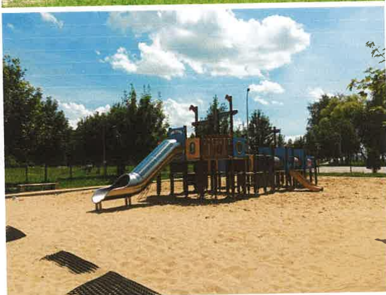
Plac zabaw Osiedle Piłsudskiego