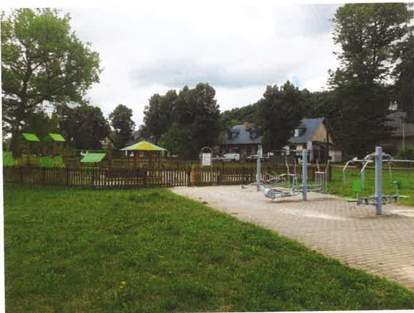
Plac zabaw Osiedle Betony