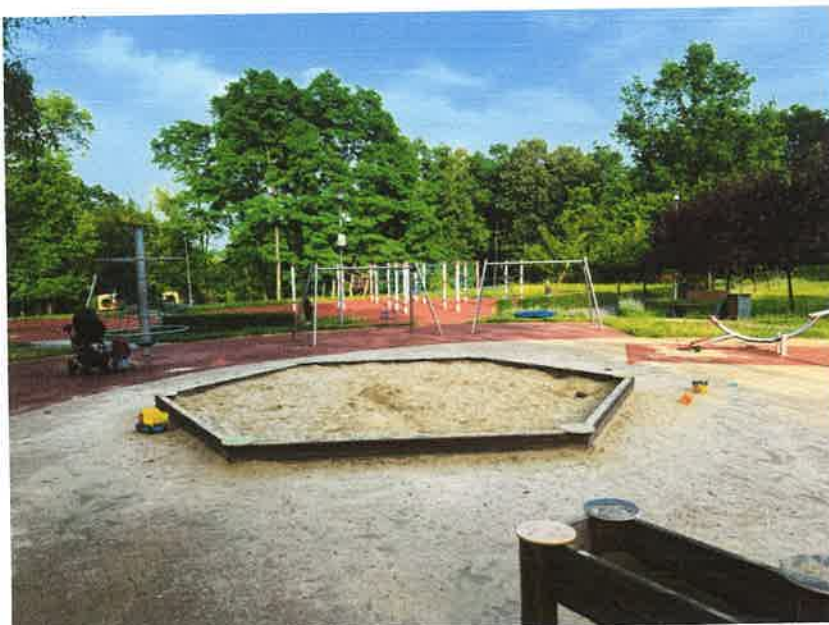
Plac zabaw w Parku Prochownia