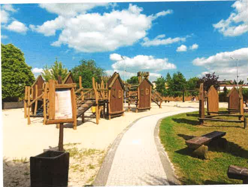
Grodzisko zabaw ul. Kombatantów