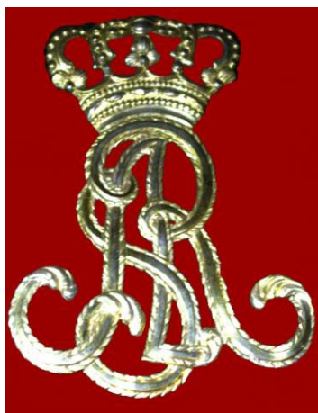
Monogram Stanisława Augusta Poniatowskiego

Ogniwo drugie to okrągły medalion z błękitnym kołem, na którym umieszczono złoty, ukoronowany monogram SAR – Stanislaus Augustus Rex, króla Stanisława Augusta Poniatowskiego. Ma to upamiętnić fakt, że ostatnim właścicielem miasta był polski rząd oraz, że Stanisław August nadał miastu obecny herb.