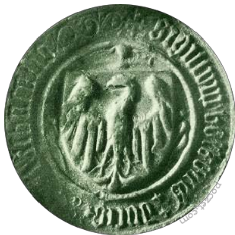
Pieczęć Bolesława I cieszyńskiego

Łańcuchy władzy Czeladzi składają się z dwudziestu trzech ogniw. Ogniwo pierwsze to okrągły medalion z błękitnym kołem, na którym znajduje się złoty górnośląski orzeł. Ma to symbolizować fakt, że do 1443 roku właścicielami Czeladzi byli książęta śląscy z linii opolskiej, bytomskiej i cieszyńskiej. Konkretna stylizacja orła została zaczerpnięta z pieczęci księcia Bolesława I cieszyńskiego, za którego rządów Czeladź po raz pierwszy wymieniono w źródłach jako miasto. Orzeł zwrócony jest w ukłonie heraldycznym do wewnątrz łańcucha.