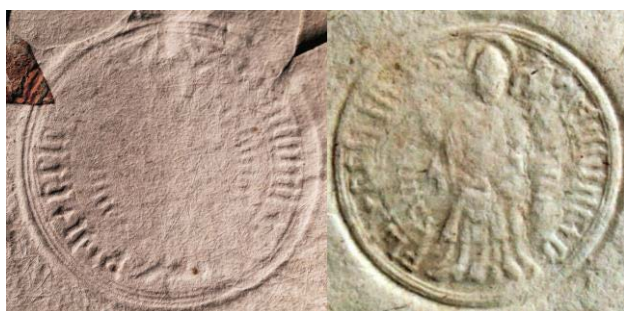
Odciski pierwszej pieczęci miejskiej Czeladzi

Pierwsze dwa rzędy AKKK, Libri Archivi, XI Transactiones, karty 11-14, 20, 94, 233, 286, lata 1501-1516 Rząd trzeci, zdjęcie pierwsze: AGAD ASK XLVI – Lustracje, rewizje i inwentarze dóbr królewskich, Przywileje dla dóbr biskupstwa krakowskiego nadane od r. 1498 k. 211, sygn 1/7/09/62a k. 211, rok 1786 („Dezyderia miasteczka Czeladzi”).