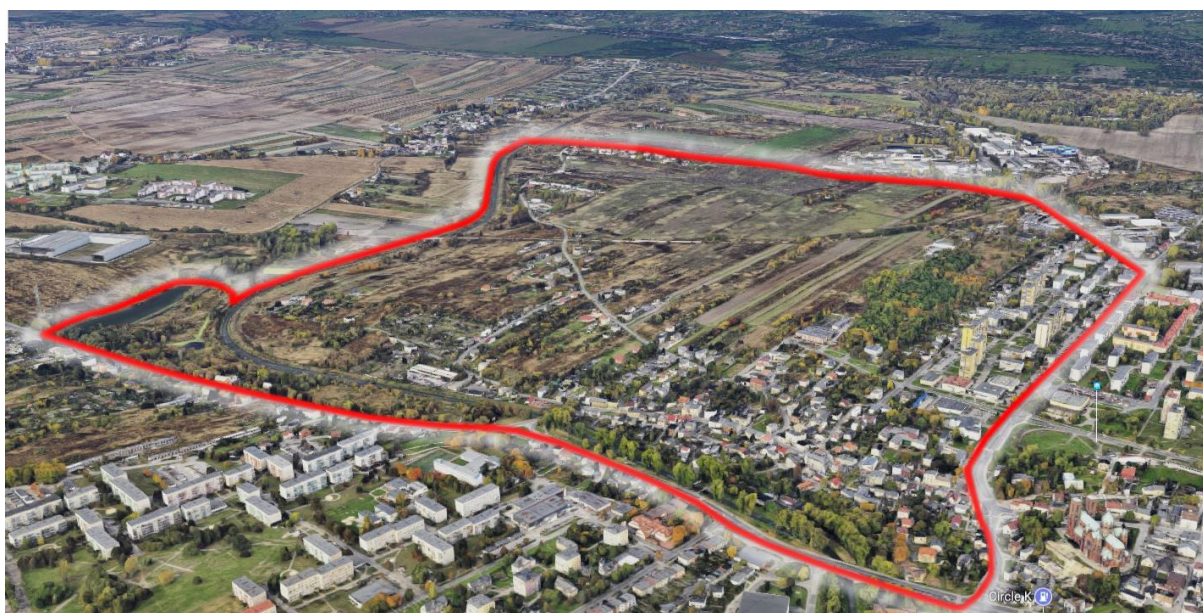
Rysunek 2 Widok „z lotu ptaka” na obszar objęty ustaleniami planu miejscowego.

Krajobraz obszaru opracowania charakteryzuje się dużym udziałem zieleni niezagospodarowanej oraz licznymi zabudowaniami mieszkalnymi jednorodzinnymi i wielorodzinnymi, których największe skupiska znajdują się w skrajnie południowej oraz wschodniej części obszaru opracowania. Zachodnią granicę analizowanego obszaru stanowi rzeka Brynica. Ponadto w południowo-zachodniej części obszaru znajduje się zbiornik wodny.