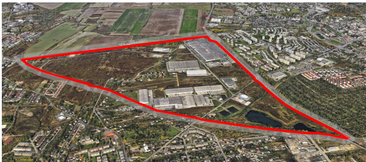
Rysunek 2 Widok „z lotu ptaka” na obszar objęty ustaleniami planu miejscowego.

Krajobraz obszaru opracowania charakteryzuje się dużym udziałem zieleni niezagospodarowanej oraz licznymi obiektami usługowymi. W północno-wschodniej oraz przy jego południowo-zachodniej granicy znajdują się obiekty usługowe zajmujące znaczące powierzchnie. W skrajnie południowej części obszaru znajdują się zbiorniki wodne. W krajobrazie widoczne są również zabudowania mieszkalne jednorodzinne, których największe skupisko znajduje się w centrum analizowanego obszaru.